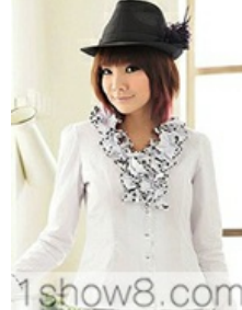
1show8.com Q-1689 â'sĭ äwö±¹lk :÷191... 191 C 6ĭ | -p